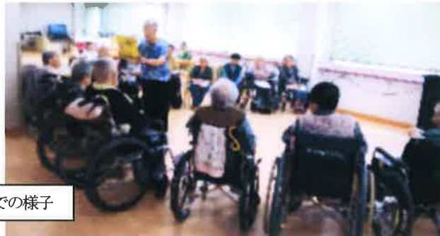
福祉施設での様子

お父さんやお母さんと一緒だったり、兄弟、姉妹、一人で来る子もいます。少人数で楽しい時間を過ごします。残念ながら、どなたも来られない日もあります。