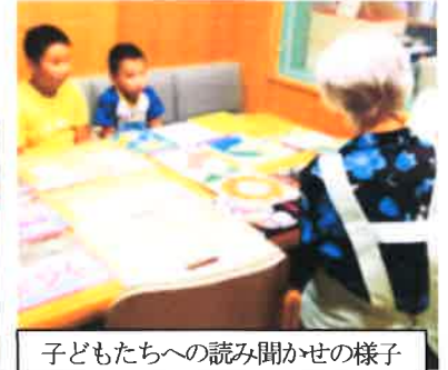
子どもたちへの読み聞かせの様子