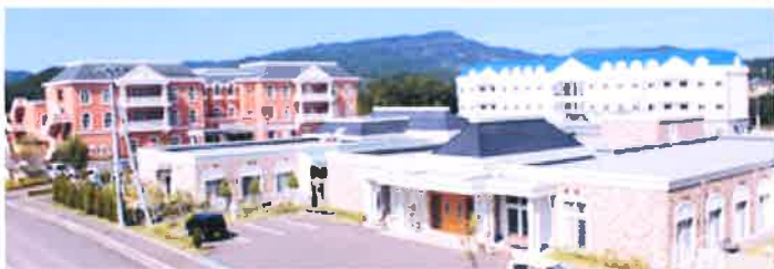
グランパランいまり

今後も施設等との意見交換会を開催してボランティア活動の参考にしていきたいと考えております。