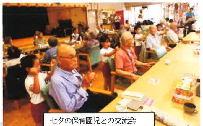
七夕の保育園児との交流会

ユートピアからも細やかなボランティア活動が出来たらと思ひ頑張っていきます。超高齢者社会を少しでも豊かに暮らしていけるように、支え合い学び合う活動をやっていきましょう。