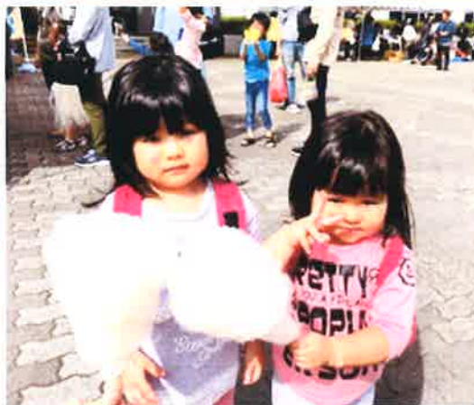
素敵な笑顔 ありがとう