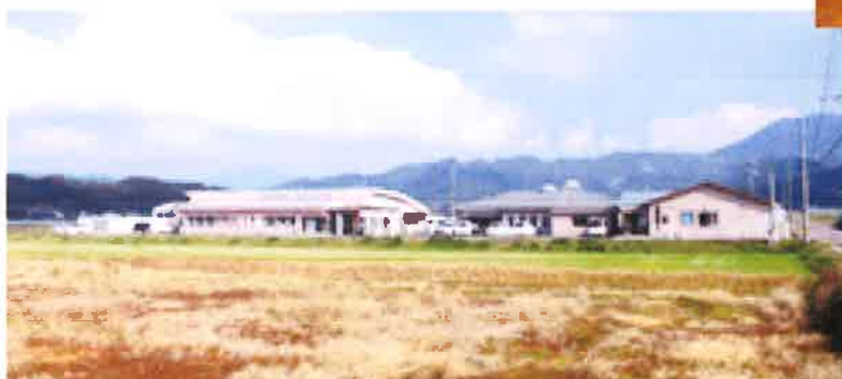
ボランティア 喫茶「和み」