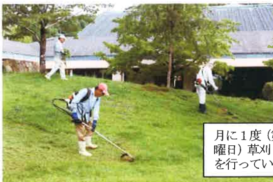
月に1度(第3土曜日)草刈り作業を行っています

もしこの作業を図書館の職員が行うとかなりの時間と労力を費やすこととなりますので、とても助かっています。他にも活動は幅広く、以前から北の庭や駐車場の周りにツツジの苗木を100本植えてくださっています。おかげでゴールデンウィークの頃にはあざやかな色の花が咲き、来館者の目を和ませています。