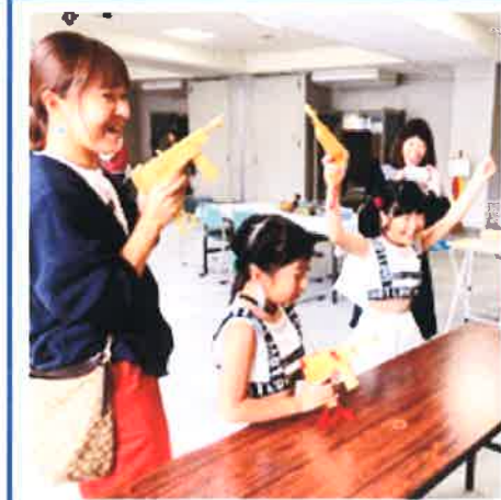
第15回 ボランティア まつりで 出会った 笑顔です

3月 22日(日) 11:00~14:30 「伊万里市民図書館内 福祉喫茶 あおぞら」 ひまわりカフェ