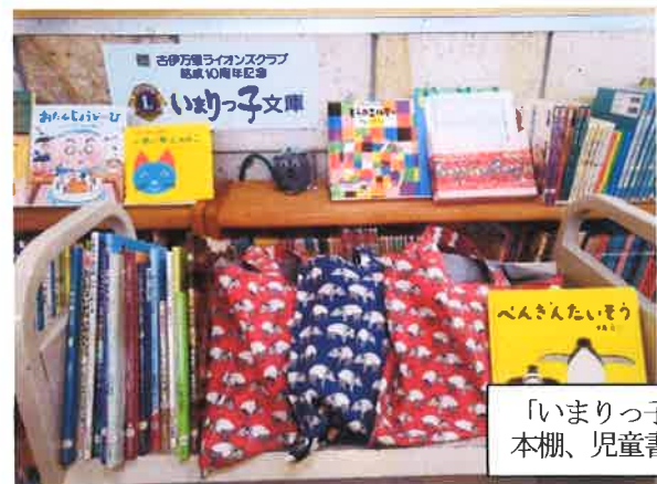
「いまりっ子文庫」本棚、児童書寄贈

さらに、子ども達のために絵本も寄贈されています。この事業は会員が次の世代に何か残したいとの思いから、結成10周年の平成25年に「いまりっ子文庫」として、本棚と146冊の児童書を贈られました。以来、毎年40冊程度の絵本を追加して、本棚の充実を図られています。(今年は、2月20日に寄贈されました。)