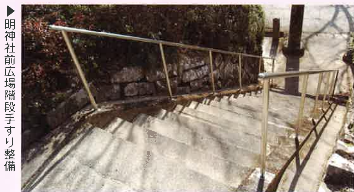
▶明神社前広場階段手すり整備