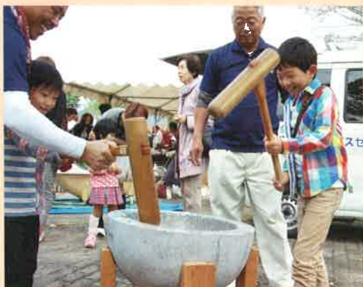
▲昨年のボランティアまつりの様子

内容 ボランティアアグループによるバンド演奏や踊り、手話コーラスなどの活動発表や、健康マージャン、福祉体験コーナー、お琴の体験教室、市社会福祉協議会表彰式など内容は盛り沢山です。おみや日用品が当たるお楽しみ抽選会もあります。