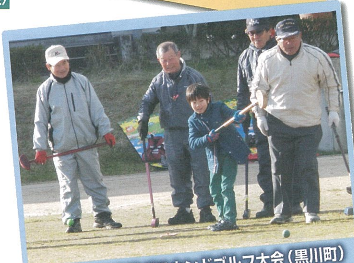
三世代交流事業グラウンドゴルフ大会(黒川町)

核家族化の進行や共働きの増加により、日頃ふれあう機会の少ない世代が、グラウンドゴルフ大会を通じて交流を深め、顔の見える関係づくりを行い、高齢者の生きがいと健康づくりを推進されています。