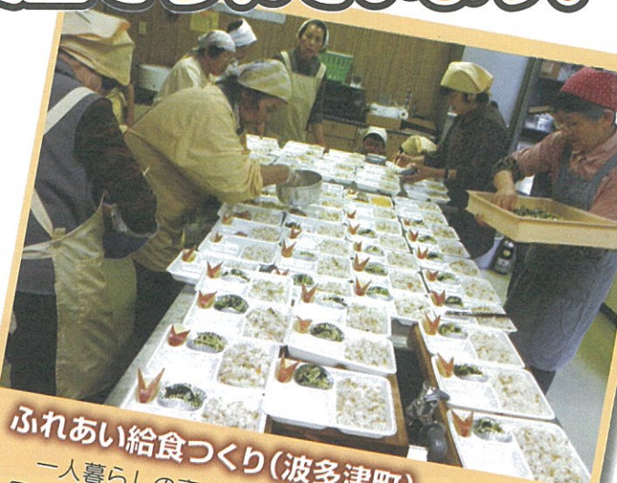
ふれあい給食づくり(波多津町)

一人暮らしの高齢者の安否確認と孤独感の解消を図るため、手作りのお弁当を用意して訪問活動をされています。この事業を通して、様々な情報提供や悩み事の聴取、いざという時の事故防止に繋がります。