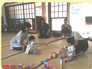
地域の子育てひろば