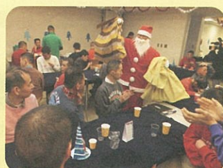
障害者福祉施設の歳末クリスマス会