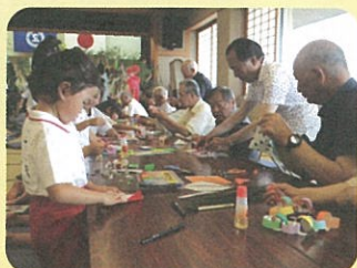
一人暮らし高齢者と子どもたちのふれあい交流事業