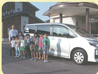
児童福祉施設の社会参加や通院等用車両整備