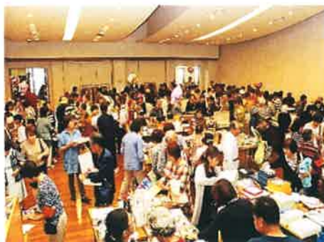
【チャリティーバザーの様子】

今後も継続して、朝の環境整備やチャリティバザーを通して、明るく豊かな街づくりに微力ながら貢献して参ります。