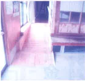
▲平成29年度波多津町 馬蛤潟公民館改修工事事業