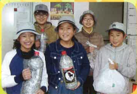
▲伊万里小学校よりたくさんの プルタブをいただきました（3/1）