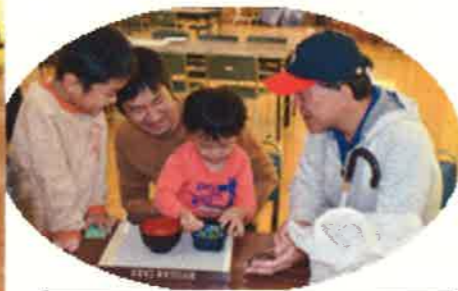
視覚障がい者の会との交流でゲームをしました。