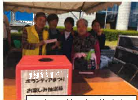
お楽しみ抽選券交換受付