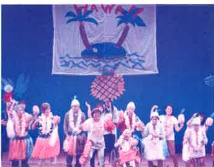
▲昨年のステージ発表の様子