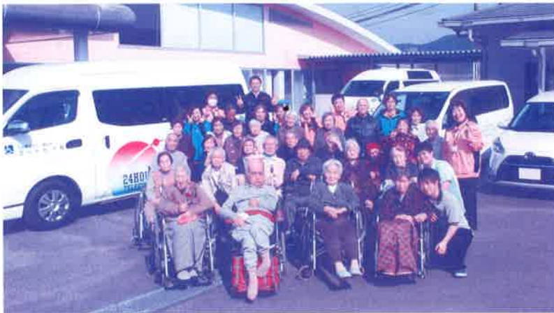
ユートピア 利用者様とスタッフのみなさん

昨年、全国の募金会場において総額8億9,376万7,362円(伊万里市519,347円)の募金をお寄せいただきました。今般、県内において車両の贈呈が表記の団体に決定しましたのでお知らせいたします。