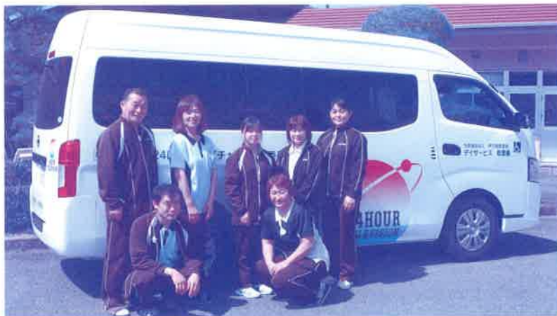
敬愛園スタッフのみなさん