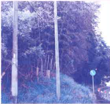
▲平成30年度南波多町古里区防犯灯設置工事事業