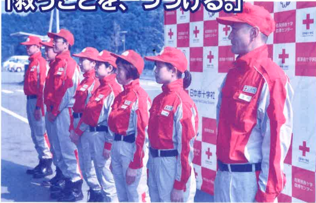
▲平成 30 年 7 月豪雨災害 被災地広島へ向かう日赤佐賀県支部救護班