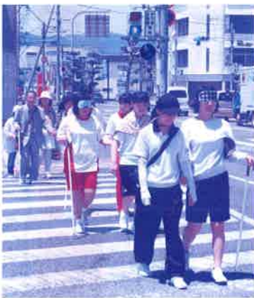
▲前回の体験歩行の様子