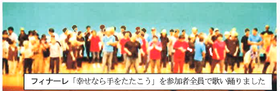
フィナーレ「幸せなら手をたたこう」を参加者全員で歌い踊りました