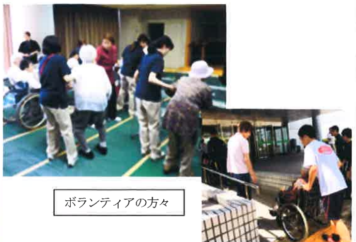
ボランティアの方々