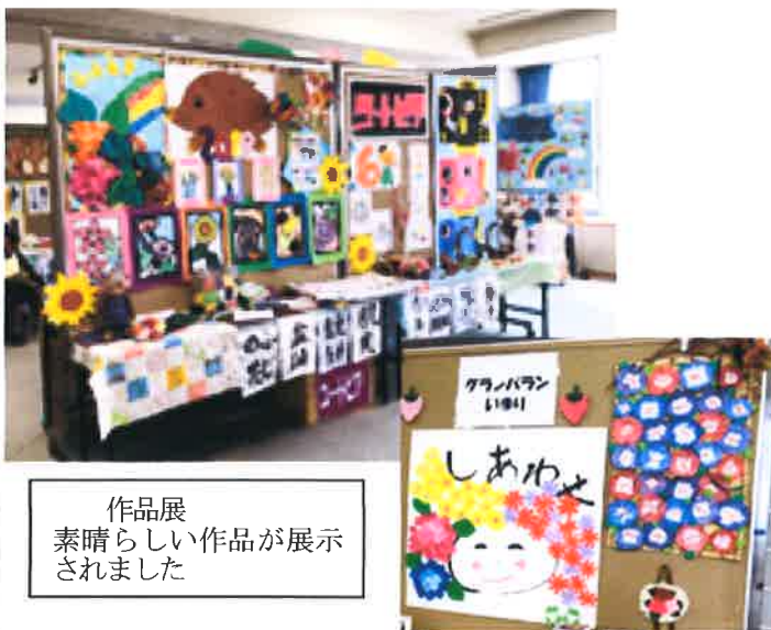
作品展 素晴らしい作品が展示 されました