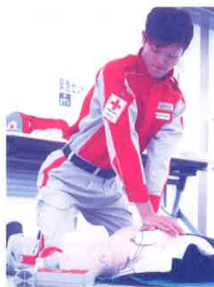
▲救命手当講習を行う赤十字職員

また、大規模な災害が起きたときに日本赤十字社が募集する義援金※についても、義援金の管理や送