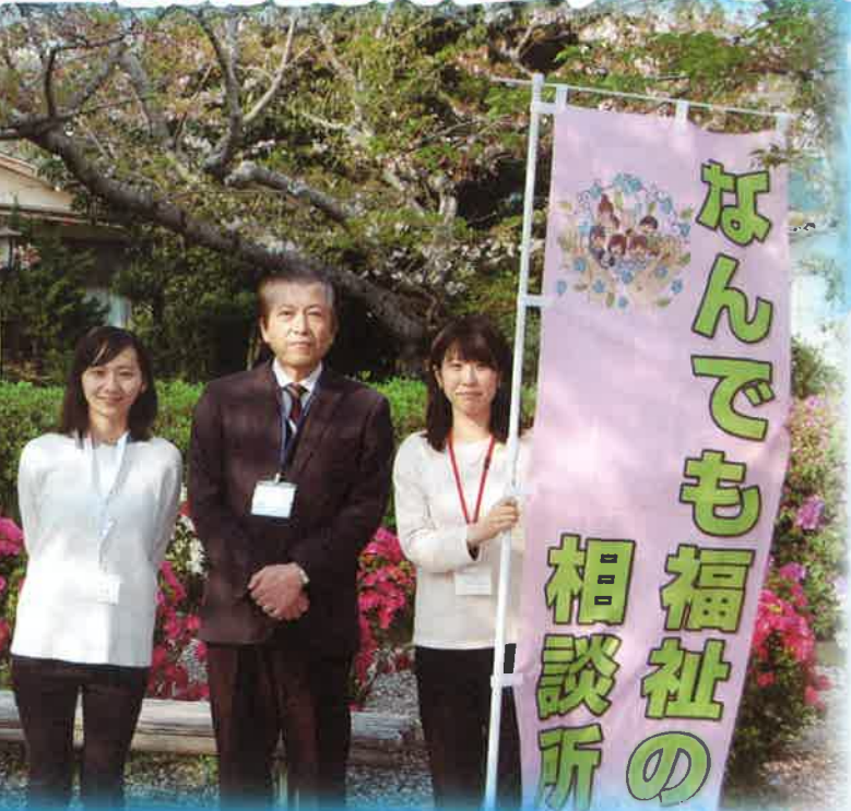
▲写真は令和2年4月採用の伊万里市社会福祉協議会事務局職員