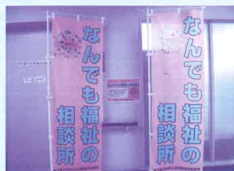
▲なんでも福祉の相談所目印