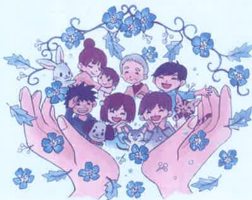
▲イメージイラスト