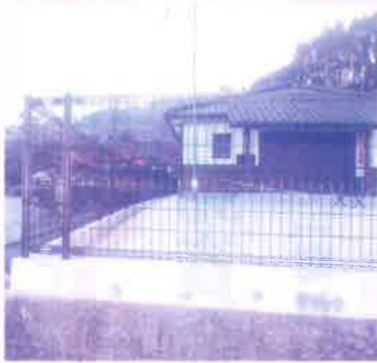
▲令和元年度中山公民館フェンス設置工事業(波多津町)