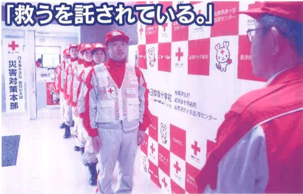
▲令和元年8月豪雨災害被災地へ向かう日赤佐賀県支部救護班