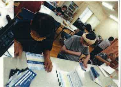
ダイレクトメールの発送準備