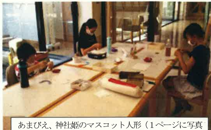
あまびえ、神社姫のマスコット人形(1ページに写真掲載)作りを楽しみました。

子どもと付き合う時いつも思うのは、大人がどの段階まで手を出すか…これがいつも迷う所です。