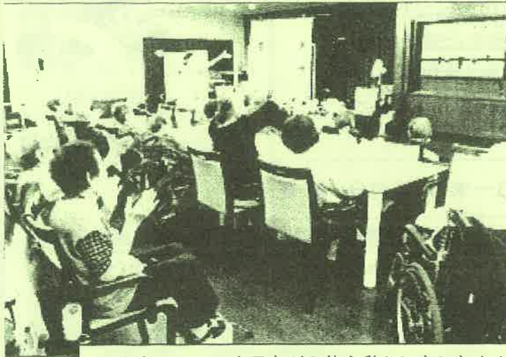
みんなでDVDを見ながら体を動かしました♪♪

昼食前の時間に、職員と利用者様と一緒にDVDを観ながら体操をして活用させていただきました。とても素晴らしい取り組みなので、今後も続けて欲しいと願います。