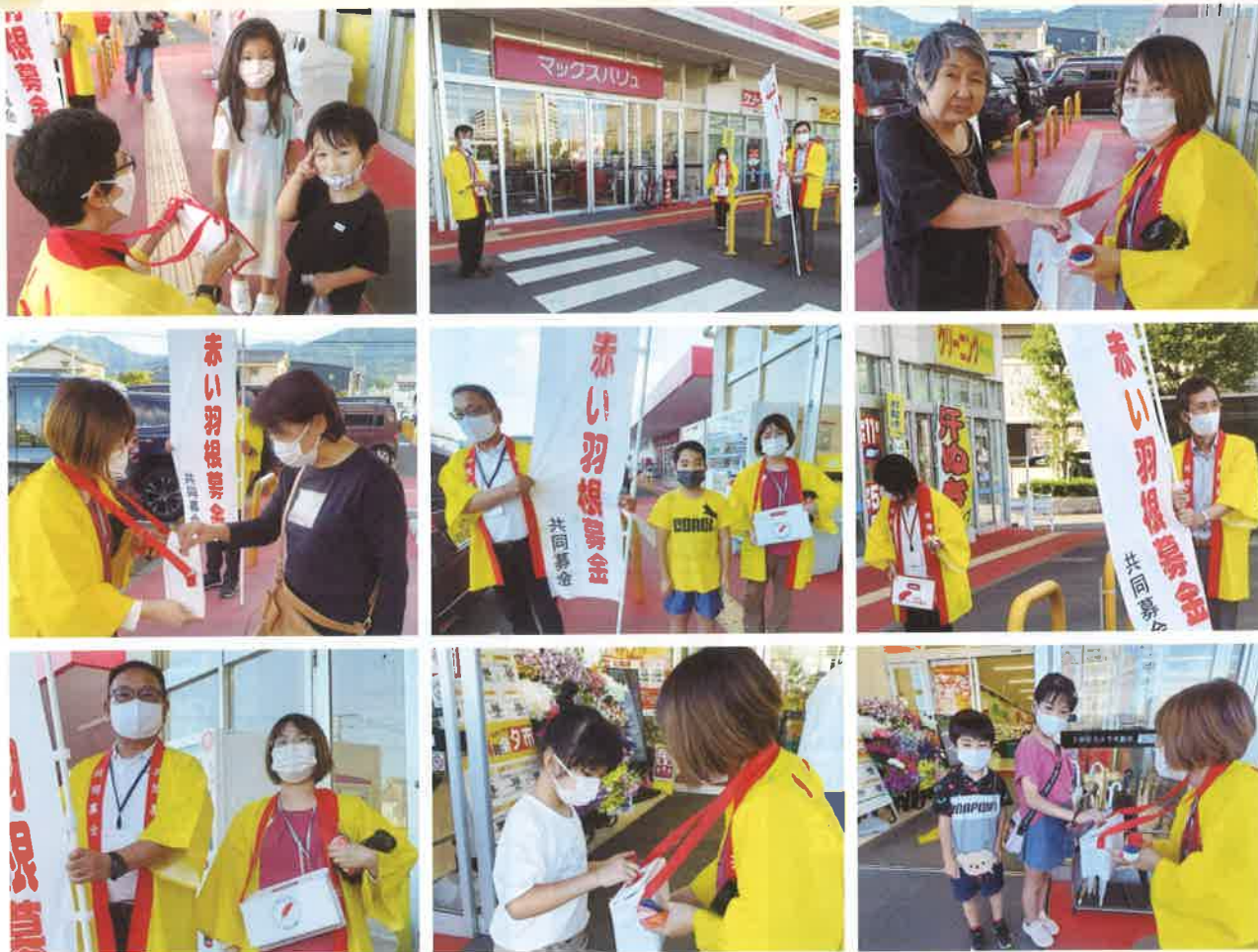
▲街頭募金の様子 (マックスバリュ伊万里駅前店 10.1)