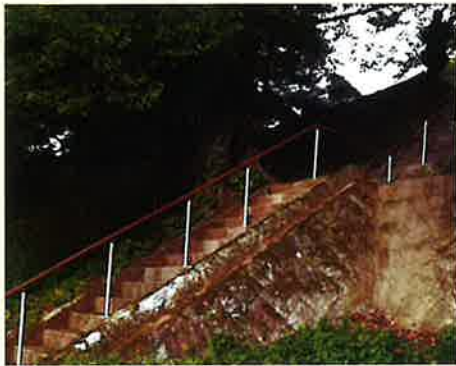
▲昨年度手すり設置工事された階段 (山代町峰区)