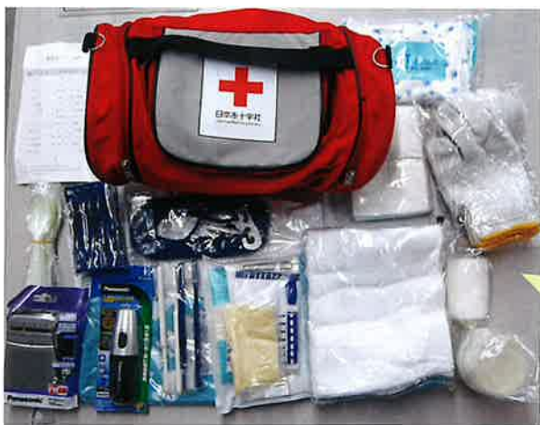
▲被災世帯に贈呈する緊急セット

緊急セットにはタオル、ティッシュ、軍手、コップ、スプーン・フォークセット、歯ブラシ、懐中電灯、ラジオ等が入っています。 令和7年度、伊万里市地区では火災等で被災された5世帯の方へ緊急セットと毛布等を贈呈しました。