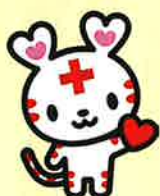
赤十字公式キャラクター「ハートラちゃん」

日本赤十字社佐賀県支部では、国際赤十字・赤新月連盟、各国赤十字国際委員会及び日本赤十字社等が行う、イラン及び紛争の影響を受ける周辺国その他の国々における被災者への救援・復興支援活動等を用途として、救援受付を行うこととなりました。