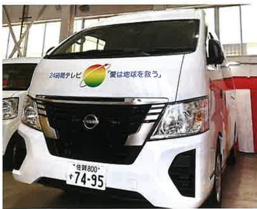
▶市内2カ所に寄贈された24時間テレビ福祉車両(リフト付バス)

公益社団法人24時間テレビチャリティー委員会様から寄贈いただいたこの福祉車両は、デイサービスセンターの送迎車両として使われる予定です。皆様から寄せられたチャリティー募金が地域の介護福祉の向上に役立っています。募金にご協力いただきました皆様に心よりお礼申し上げます。