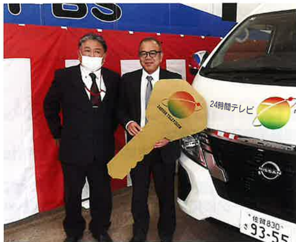
▶福祉車両の贈呈を受けた長生園(左)及び敬愛園(右)の職員さん