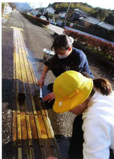
▲ 学校周辺地域の点字ブロックを清掃する児童 (大川内小学校)

伊万里市社会福祉協議会は、毎年、市内の小学校、中学校、義務教育学校、高等学校へ学校ボランティア育成事業補助金を交付しています。子ども達がさまざまなボランティア活動を通じて、地域の環境整備に目を向ける機会となること、人権や自分たちができることは何かを考え行動する機会となることを願っています。